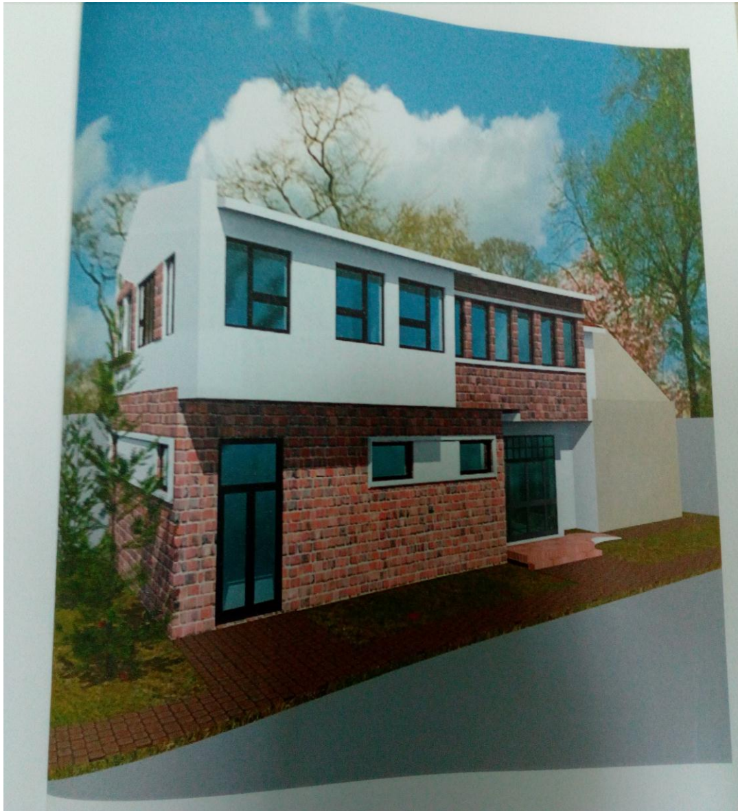
Идејно решење концертне сале коме тежимо