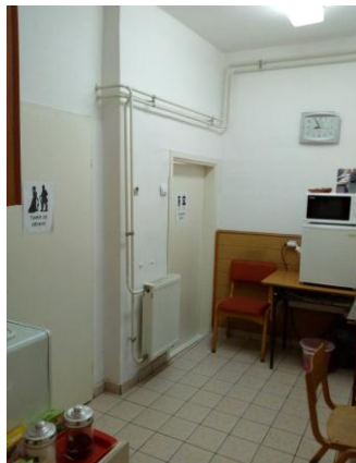
Санитарни чвор и кухиња у школи

У школи простор за рад није у складу са нормативима. Просторије за индивидуалну наставу су мале у односу на нормативе који су прописани Правилником о нормативима школског простора, опреме, наставних средстава за ОШ. Школа нема зборницу за наставнике, нема концертну салу, нити адекватну просторију за извођење јавних часова, а о проблем са тоалетом је већ горе наведен.