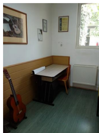
Кабинети за индивидуалну наставу: виолине, хармонике и гитаре.

Школа није у потпуности опремљена потребним наставним средствима за реализацију квалитетне наставе. 28% испитаних наставника сматра да је школа опремљена потребним наставним средствима, 44%, у већој мери, а 28 % наставника сматра да није довољно наставних средстава у школи за постизање квалитетне наставе.