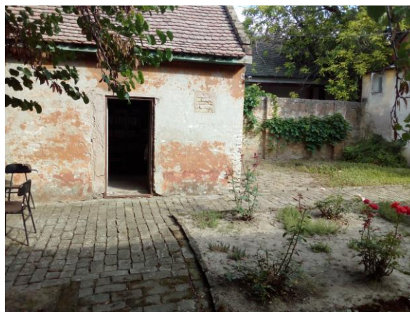
Садашње стање простора на коме се планира изградња будуће концертне сале