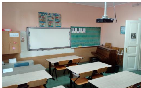
Учионица за групну наставу